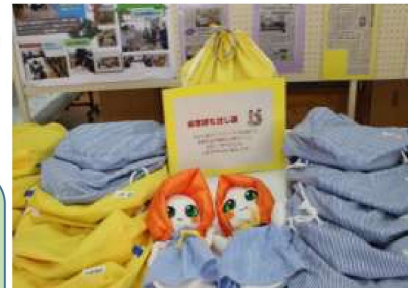
1年生製作の「非常持ち出し袋」