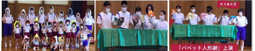
「パペット人形劇」上演