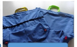
非常持ち出し袋準備