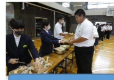
お湯ぼちや料理試食会

こんにちは！津島高校家庭クラブです！私たちは、昨年度より防災についての研究活動を通して、「自助力」「共助力」を向上させるべく、機会あるごとに経験を積み重ねているところです。新年度より、この紙面にて家庭クラブで取り組んでいることの発信を行い、中学生や地域の方にも、もしもに役立つ情報を紹介していきたいと思っています。どうぞよろしくお願いたします。