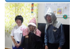
防災頭巾製作・贈呈