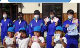
災害時用避難カード作成・贈呈